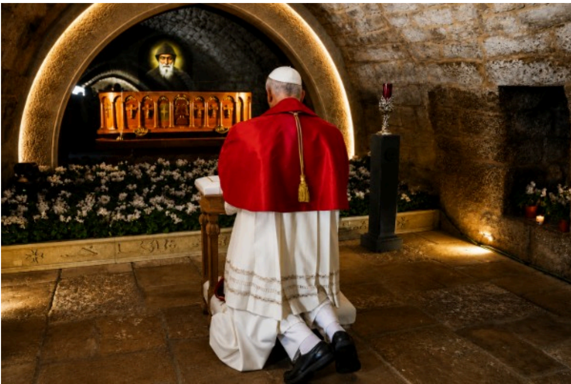
Le pape Leon XIV se recueillant devant la tombe de Saint Charbel, lors de sa visite au Liban.