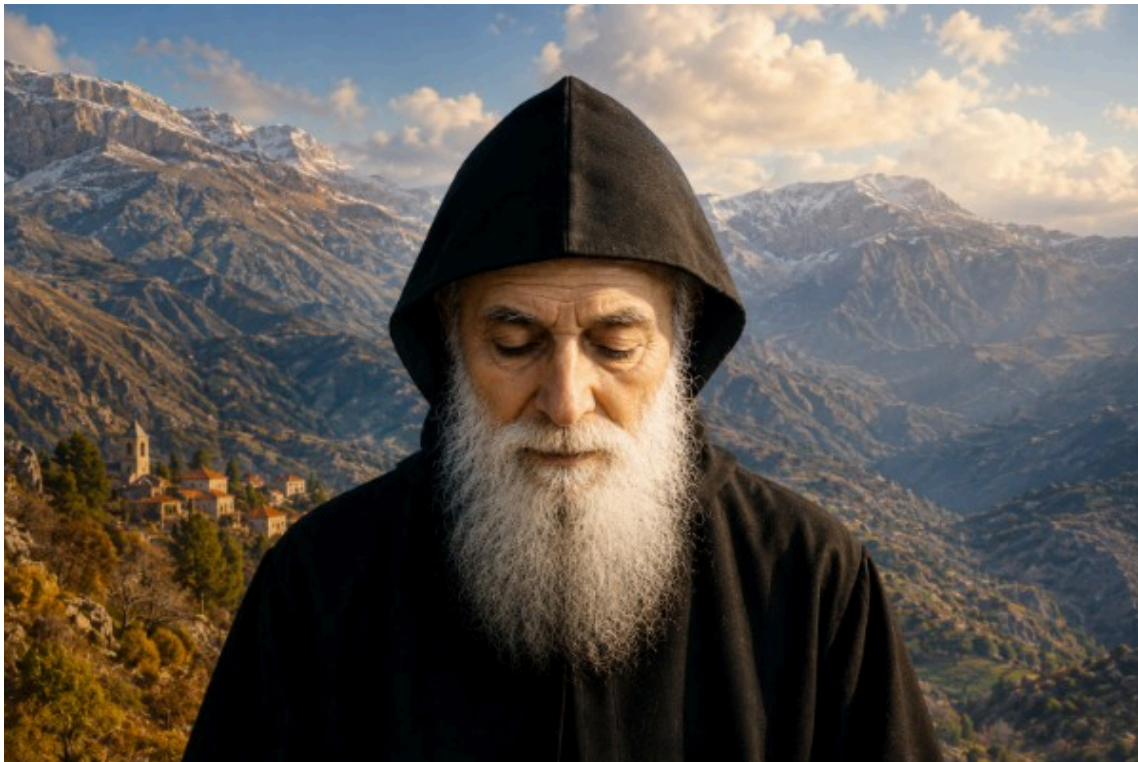
Saint Charbel Maklout

🔥 Bonjour {{ contact.PRENOM }} {{ contact.NOM }} Une providence, deux flambeaux