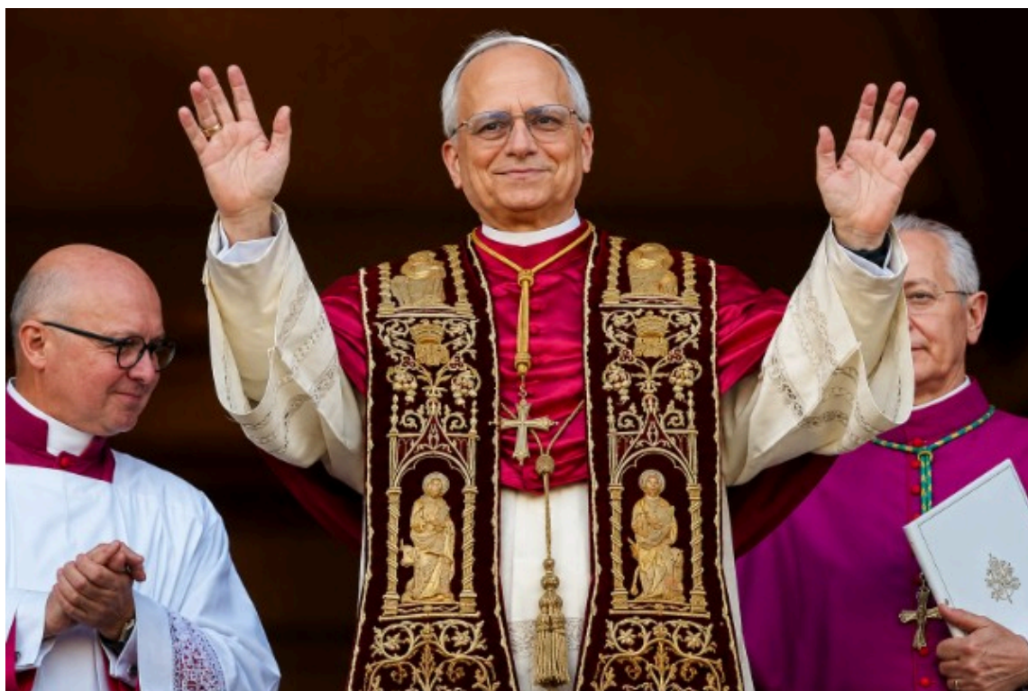
Le pape Léon XIV apparaissant pour la première fois après son élection, saluant la foule depuis le balcon le 8 mai 2025.

Quand un même jour rassemble la naissance d'un saint et la naissance d'un pontificat, ce n'est plus un calendrier qui parle. C'est une promesse.