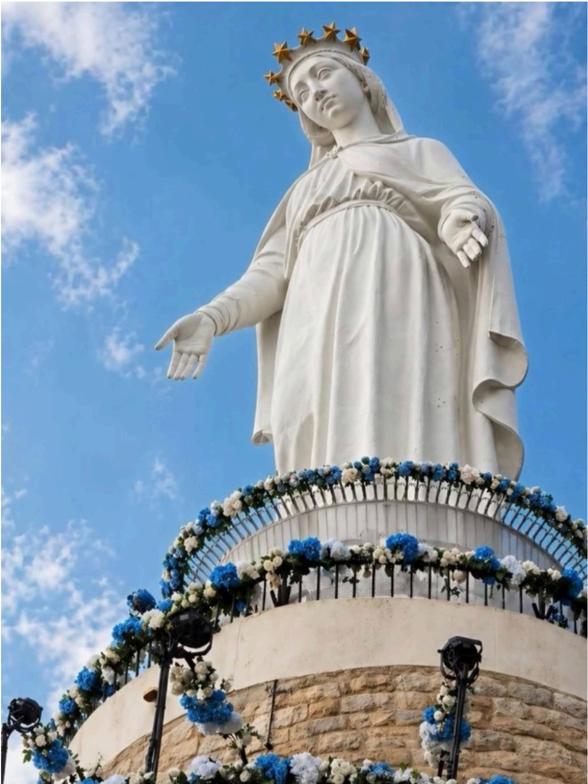
Notre Dame de Harissa - Liban