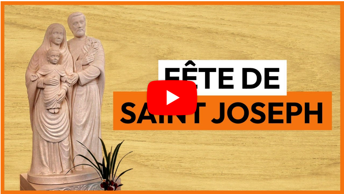
Fête de Saint Joseph 🙏