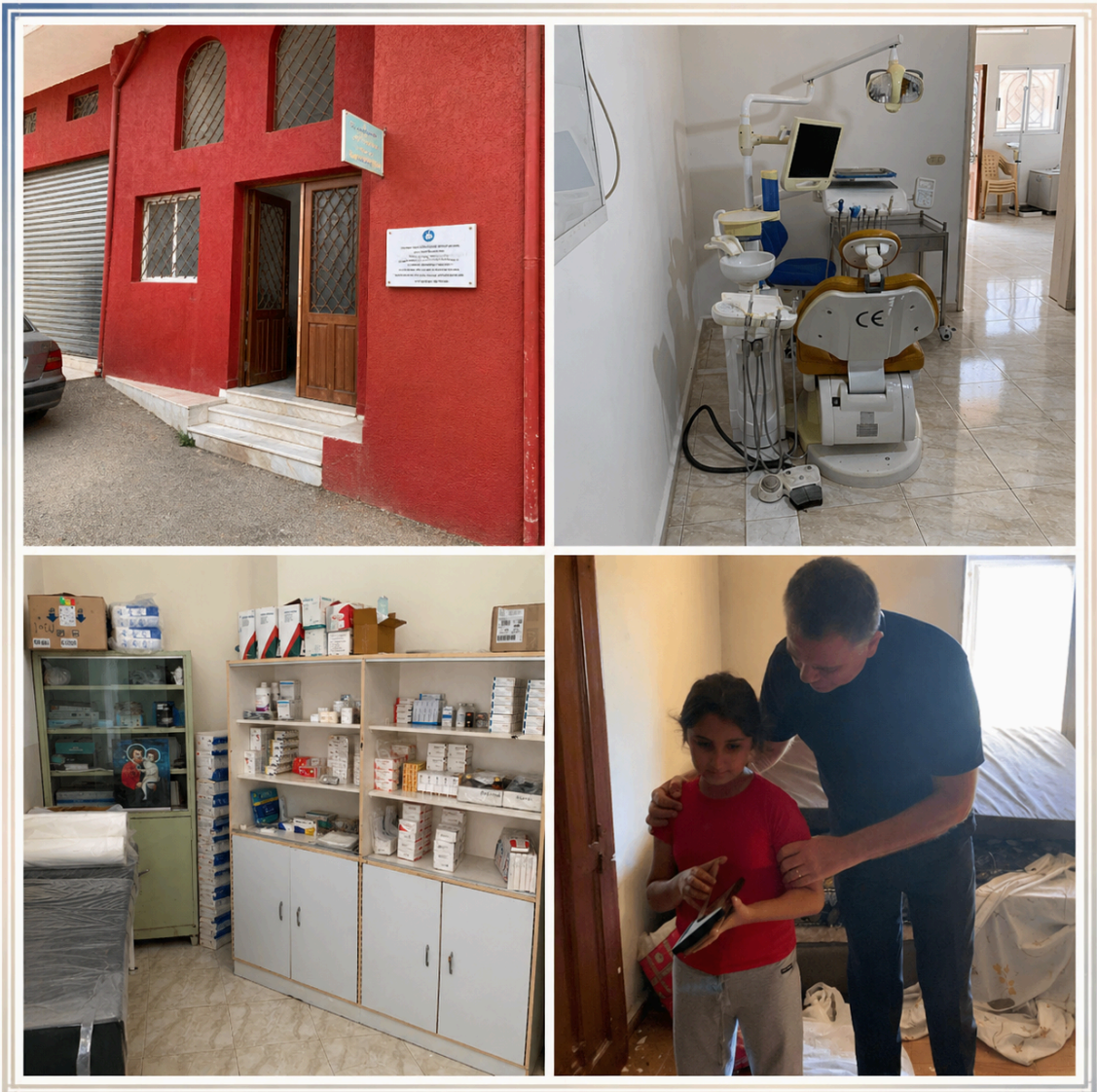
Dispensaire Saint Joseph à Hajjeh