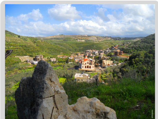
EL HAJJEH SUD LIBAN