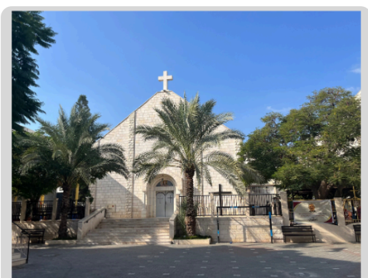
PAROISSE DE LA SAINTE-FAMILLE GAZA